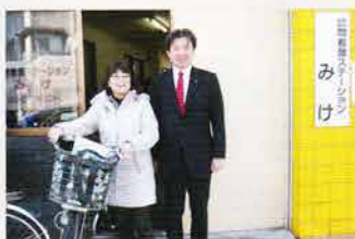
訪問看護の現場を視察する 秋葉厚生労働副大臣と共に

止める凄い能力の持ち主ばかりです。その抜群のコミュニケーション能力で「訪問看護を広報」し、日本中の方々に訪問看護を知ってご利用して戴くと共に、訪問看護師仲間を増やしていきましょう。